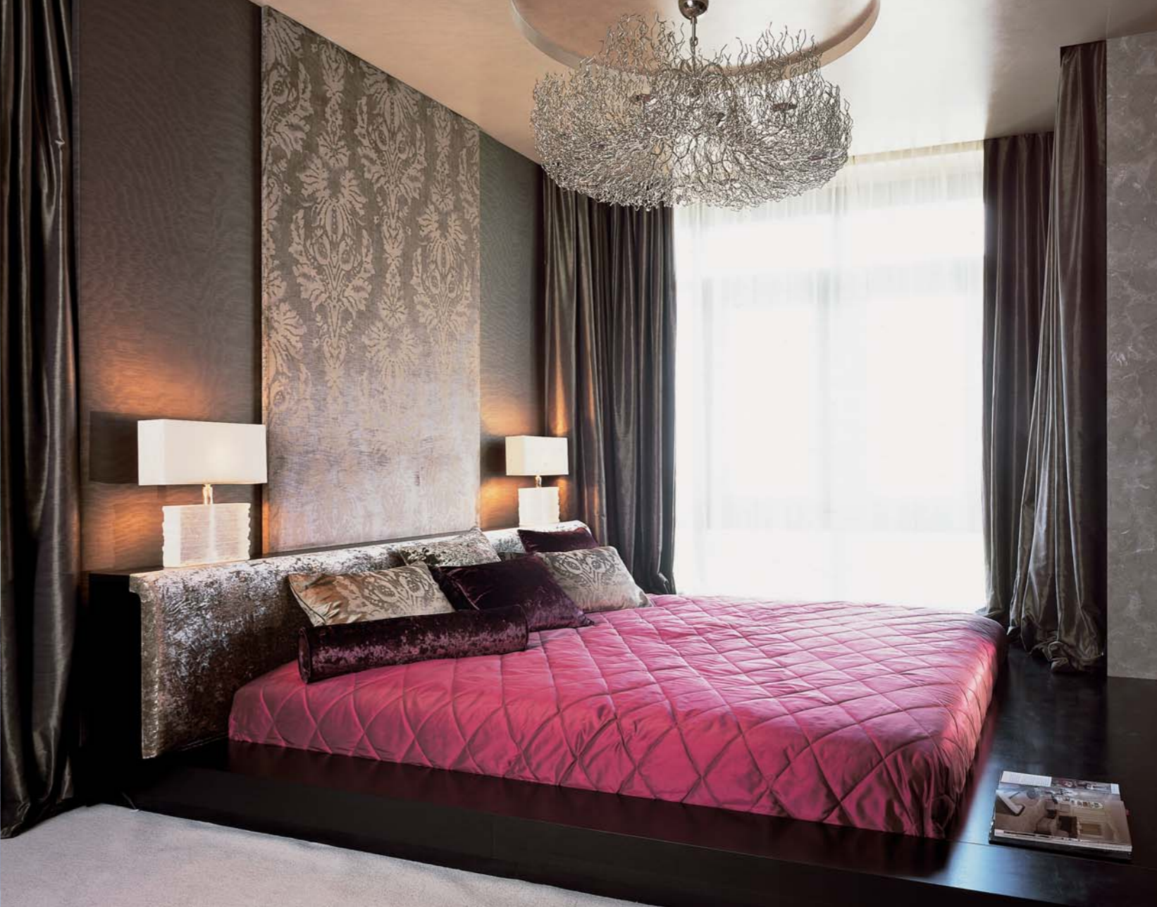
Цветовое решение спальни лаконичное, построенное на комфортных сочетаниях шоколадного и молочного

Приватная часть квартиры выделена в единый блок и включает в себя спальню, ванную комнату, санузел и гардеробную. Кровать изготовлена по эскизам автора проекта. Лежанка, Christopher Guy. Люстра, Brand van Egmond (6, 7, 8, 9)