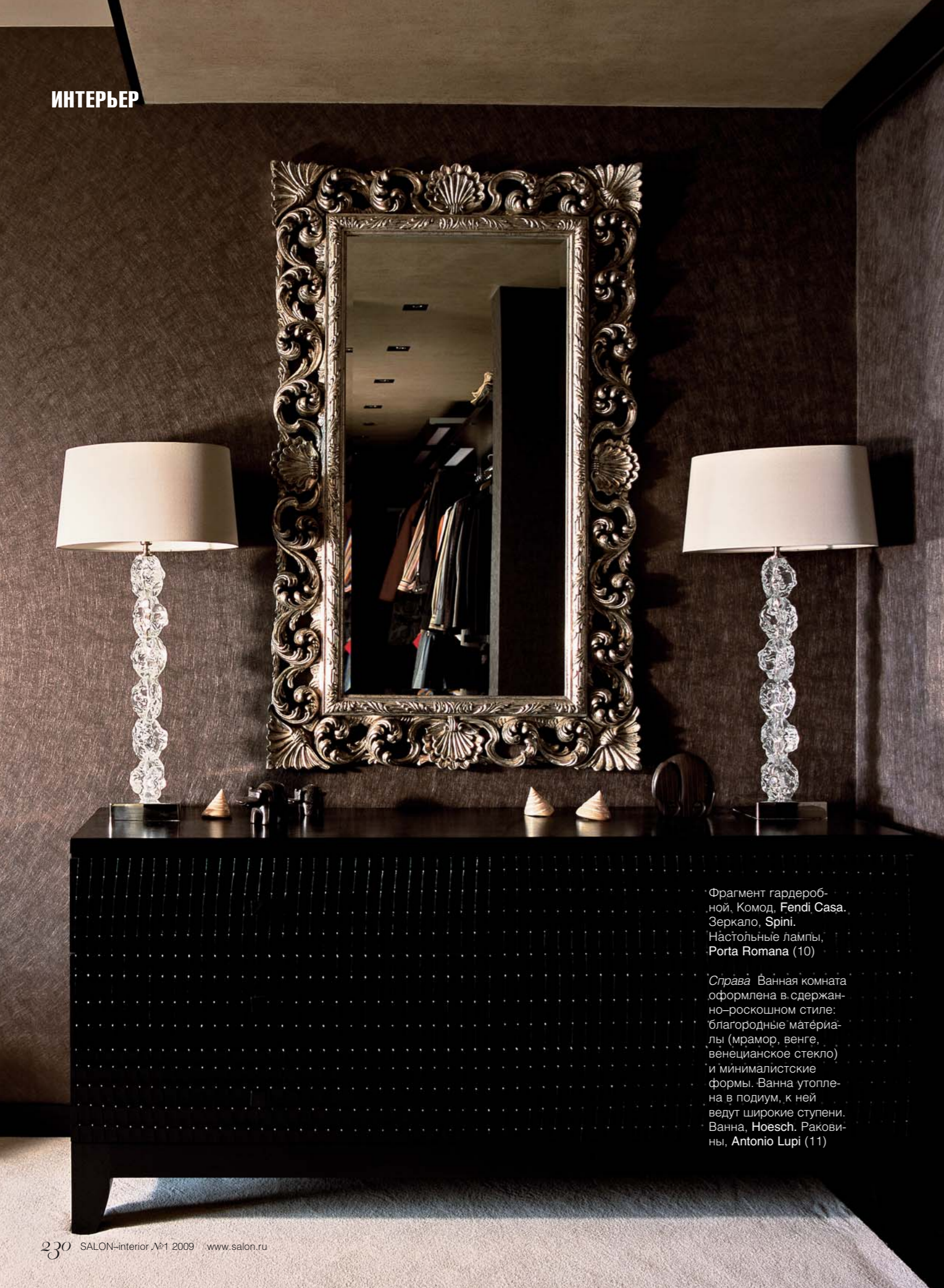
Фрагмент гардеробной. Комод, Fendi Casa. Зеркало, Spini. Настольные лампы, Porta Romana (10)