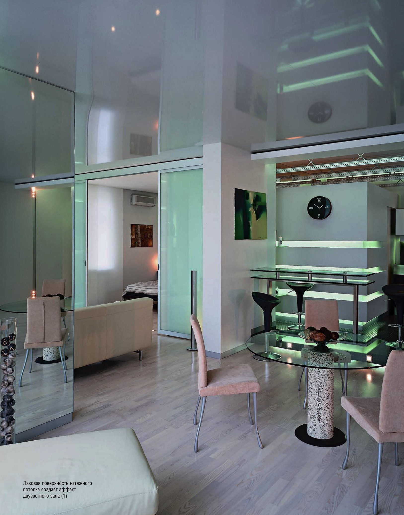
Лаковая поверхность натяжного потолка создаёт эффект двусветного зала (1)

Способность увидеть обыденность в новом измерении, выявить неприсущий ей, казалось бы, скрытый смысл—свойство, сближающее художников и архитекторов с магами. Современный дизайн способен так преображать трёхмерную реальность, что прежние формы утрачивают устойчивость, единство, размыкаются и парят в изменённом пространстве.